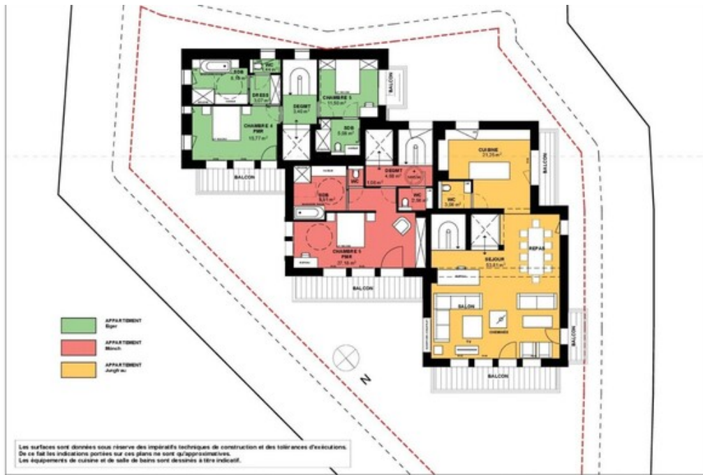
CONSTRUCTION D'UN CHALET DE 3 LOGEMENTS - ROUTE DES BRIGUES - COURCHEVEL 650