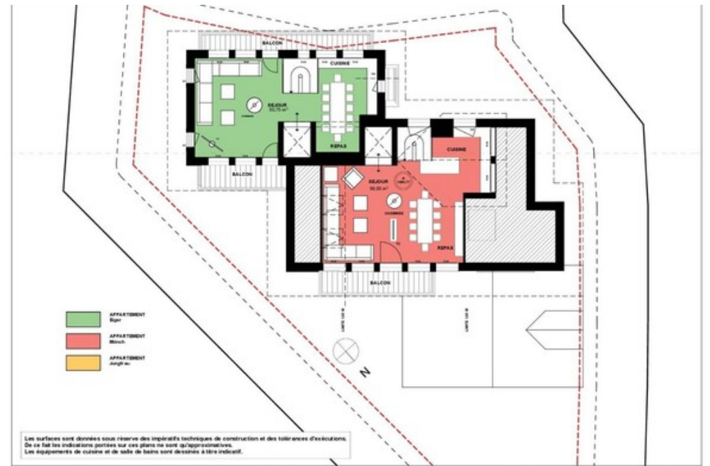
CONSTRUCTION D'UN CHALET DE 3 LOGEMENTS - ROUTE DES BRIGUES - COURCHEVEL 650