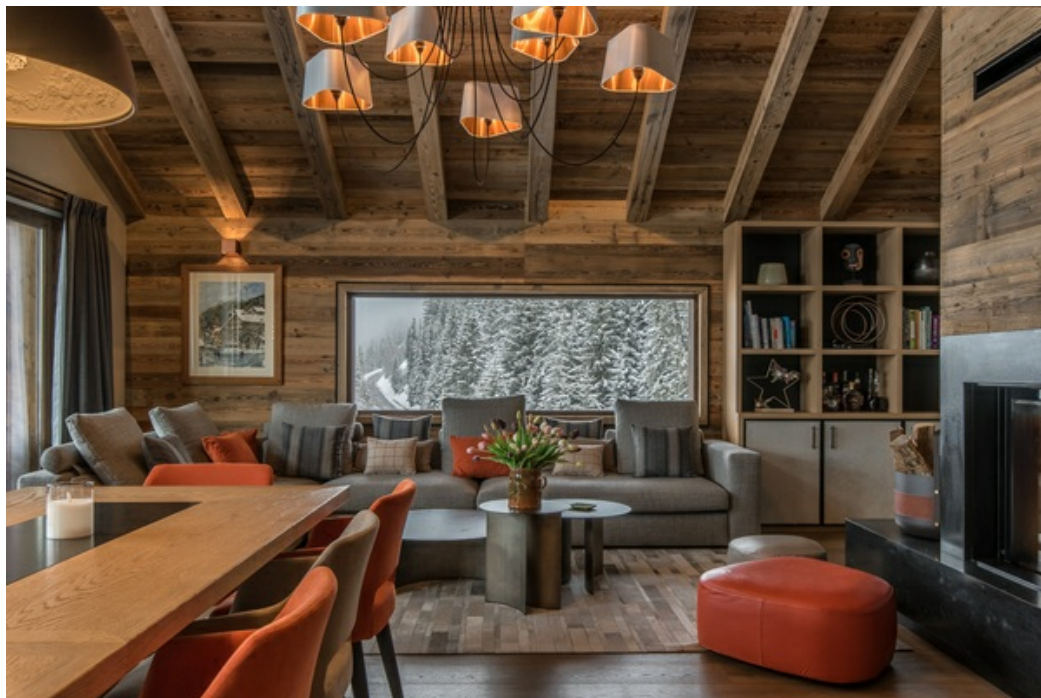
Funda para esquís