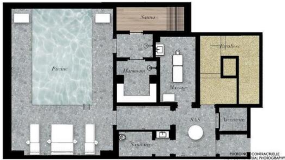
CHALET ELEONORE Etage -1