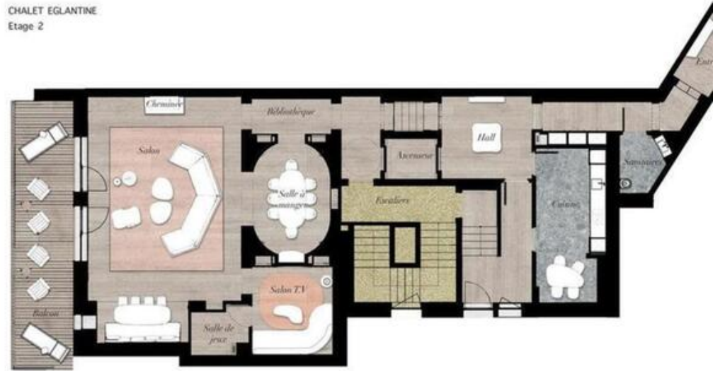
CHALET EGLANTINE Etage 2

PHOTO NON CONTRACT NON CONTRACTUAL PHOTO