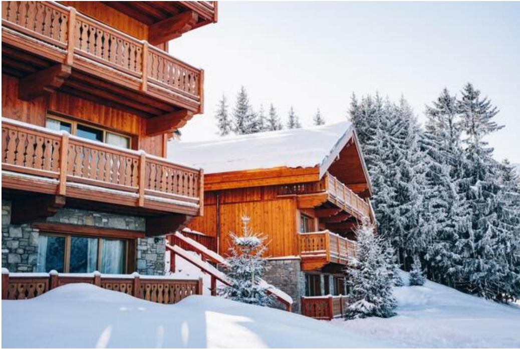
CHALET EGLANTINE Etage 1