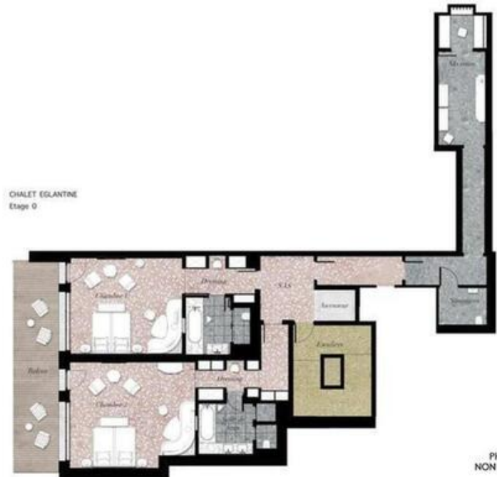
CHALET EGLANTINE Etage 0

PHOTO NON CONTRACT NON CONTRACTUAL PHOTO